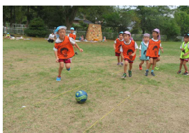
【年長サッカー教室】